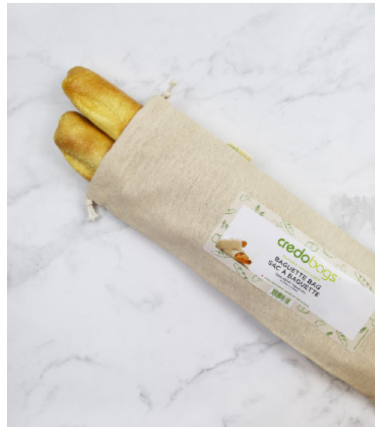
Baguette Bag Sac à baguette

11" x 16" Hemp - Linen- Organic Cotton/ Chanvre- Lin - Coton biologique Made in/fait au Canada Starting at $7.00/ À partir de 7.00$