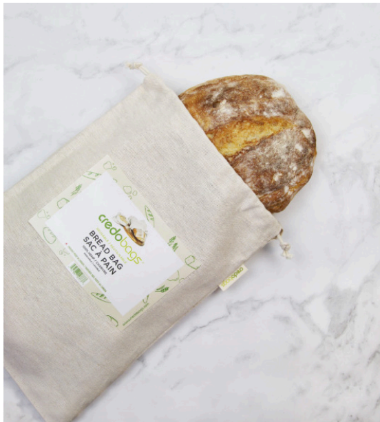
Bread/Loaf Bag Sac à pain

Ces sacs à pain sont également de plus en plus populaires pour aider à éliminer progressivement le plastique et le papier dans les boulangeries. Différentes options de tissu sont disponibles pour ces sacs - comme le chanvre et le lin en coton biologique (double face). Impression disponible avec une commande minimum de 250 pièces.