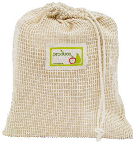
Produce Bags Filets à fruits et légumes

Les filets Credobags pour fruits et légumes sont le choix pratique pour un style de vie écologique. Réutilisez ces sacs à l'épicerie ou au marché, en remplacement des sacs jetables en plastique. Réduisez votre empreinte carbone en choisissant une solution de recharge qui est durable, réutilisable et recyclable. Montrez fièrement votre marque / logo sur ces sacs uniques afin que vos clients veuillent les utiliser encore et encore.