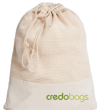
Mesh & Muslin Maille et mousseline

Medium/ Moyen 10" x 12" Large/Grand 12" x 15" 100% Cotton/coton Made in/fait au Canada Starting at $4.70/ À partir de 4.70$